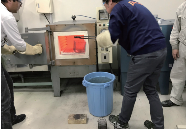
体験の一番の人気コーナー