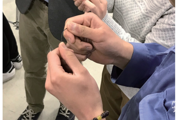
熱処理の違いによる針金の状態変化を確認します