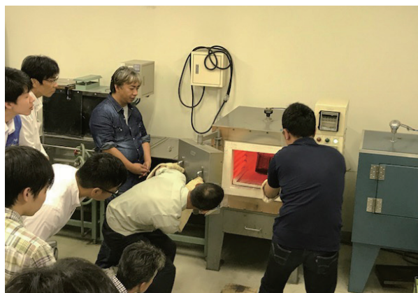
実際に熱処理体験中