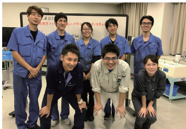
前列3名がご協力いただいた講師陣