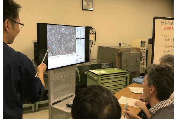
自分たちで磨いた組織の観察