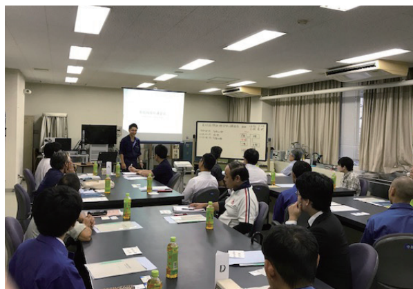
午後からの座学風景