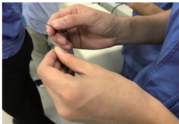
熱処理の違いによる針金の特性の差を体感