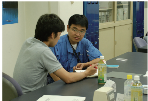
最後に個別相談も受け付けました