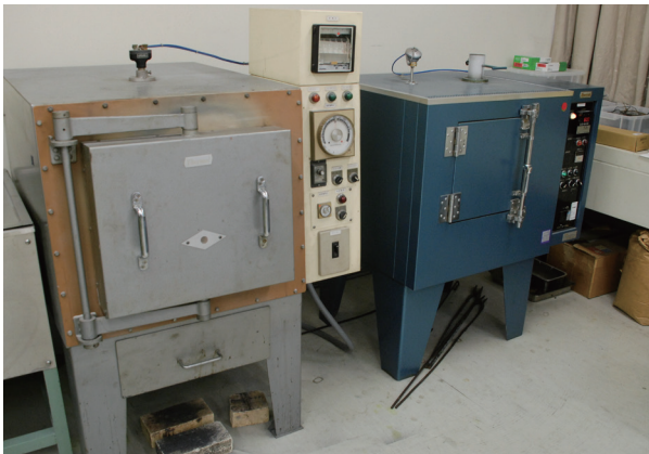
こんな設備を使って実験します