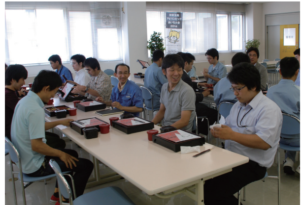
みんなで昼食タイム