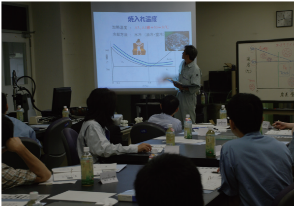
熱処理の基礎を座学で学びます